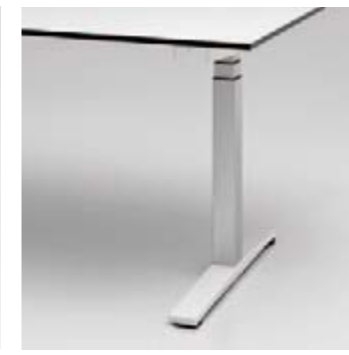
16 T-Fusstisch ohne Fussblende