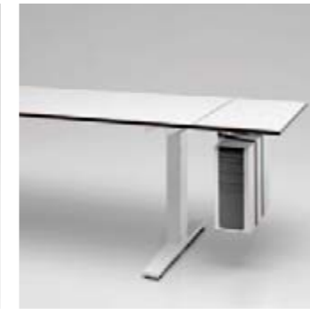
12 CPU-Halter unter Seitenbauelement