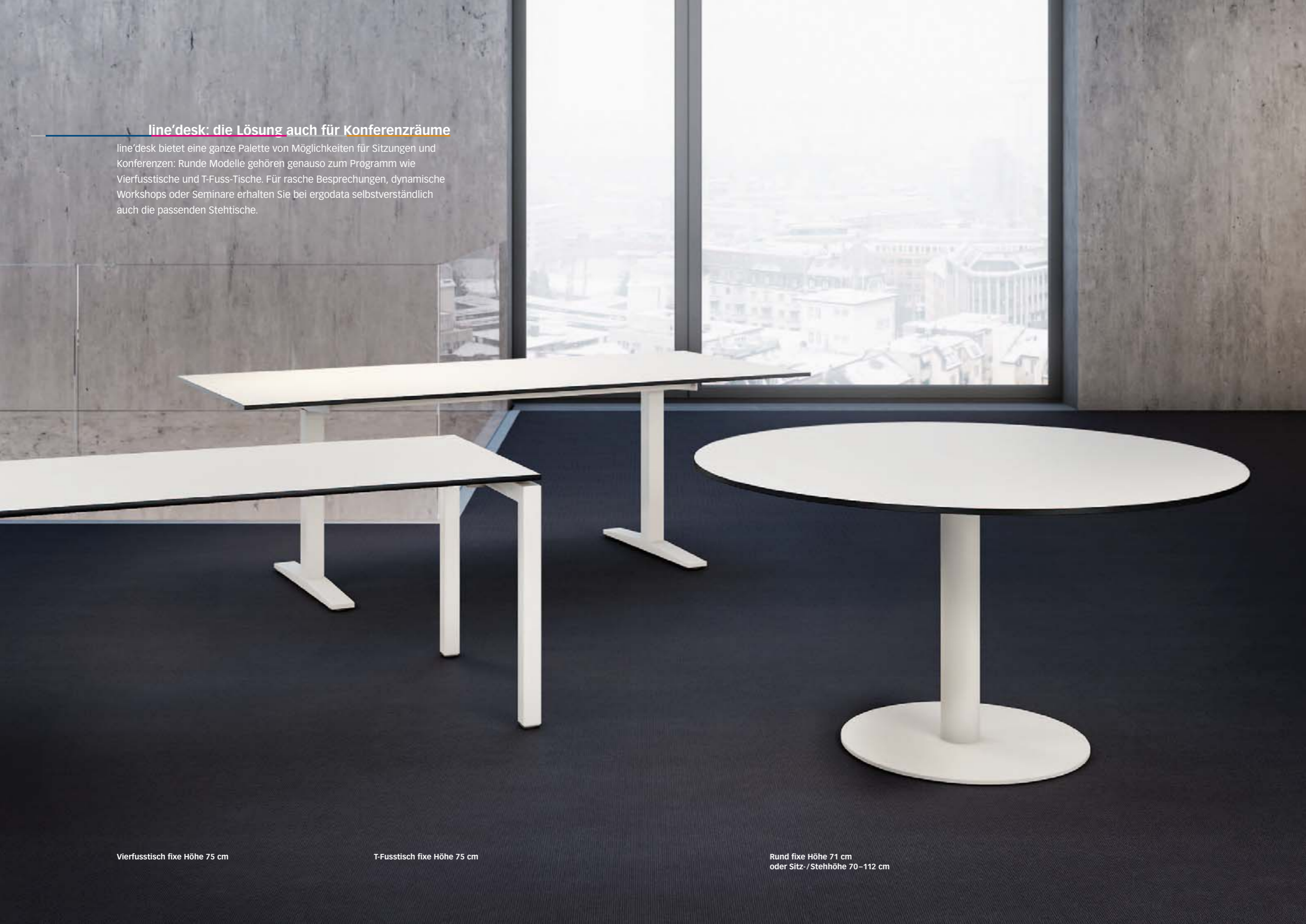
Vierfusstisch fixe Höhe 75 cm

line'desk bietet eine ganze Palette von Möglichkeiten für Sitzungen und Konferenzen: Runde Modelle gehören genauso zum Programm wie Vierfusstische und T-Fuss-Tische. Für rasche Besprechungen, dynamische Workshops oder Seminare erhalten Sie bei ergodata selbstverständlich auch die passenden Stehtische.