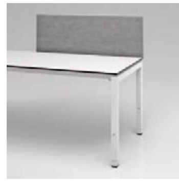
06 Privacy Panel BuzzDesk