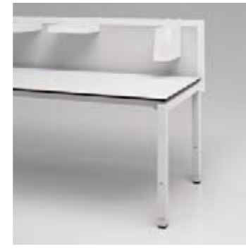
04 Privacy Panel Stahl