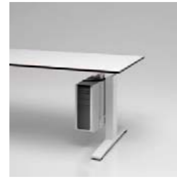
11 CPU-Halter innenseitig montiert