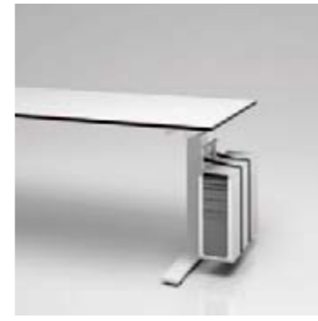
10 CPU-Halter an Tischfuss montiert