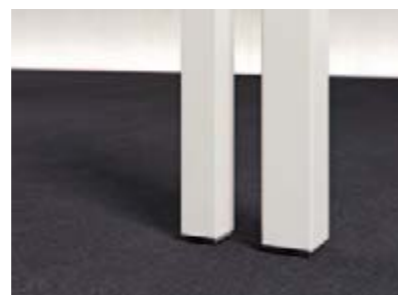
Tischbeinstärke: Stahlrohr 40 x 40 mm und 50 x 50 mm