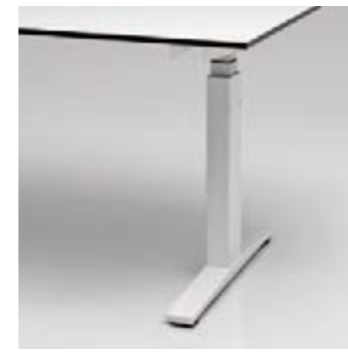
15 T-Fusstisch mit Fussblende, organisierbar