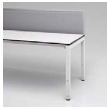
05 Privacy Panel Stoff