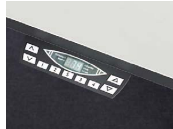
Memory-Display mit vier Speicherplätzen