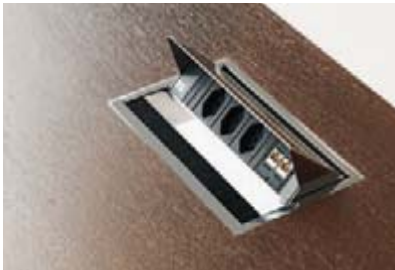
Praktisch für den schnellen Zugriff: die Mediabox