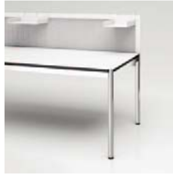
03 Privacy Panel Stahl