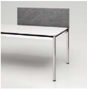
05 Privacy Panel BuzziDesk