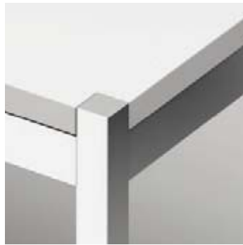
10 Quadro Aluminium eloxiert natur