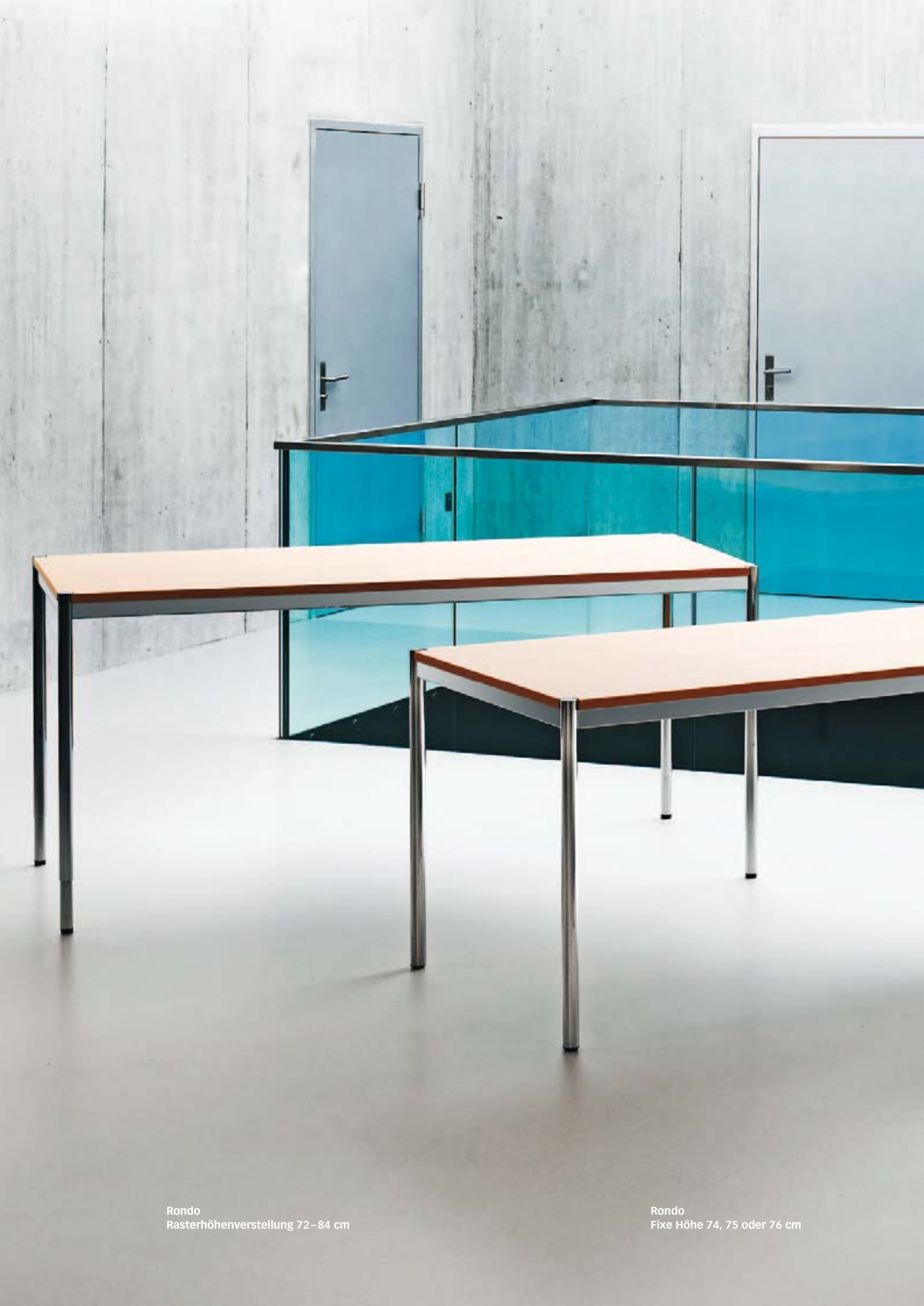
Rondo Rasterhöhenverstellung 72–84 cm