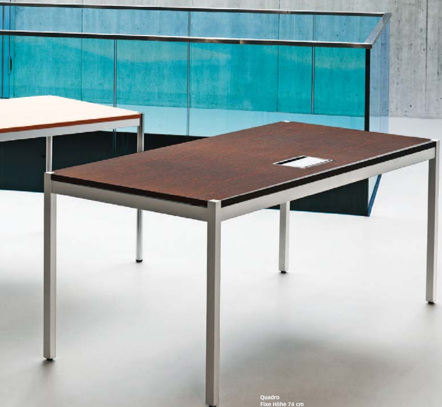
Quadro Fixe Höhe 74 cm

Oberfläche, Form, Grösse und Farbe wählen Sie ganz nach Ihrem Geschmack. Und investieren dabei in zeitloses Design zu einem optimalen Preis-Leistungs-Verhältnis. Bei ergodata bekommen Sie nachhaltig produzierte Qualität «made in Switzerland».