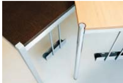
CPU-Halter: damit der PC nicht auf dem Boden steht