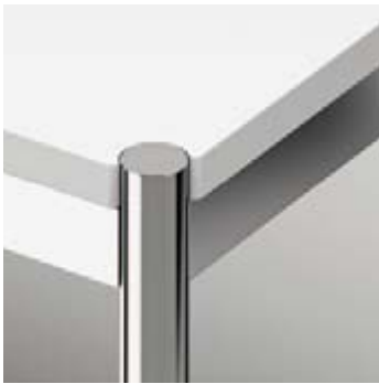
09 Rondo glanzverchromt