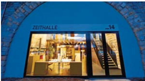
Fotografiert in den Viaduktbögen in Zürich

multi'desk mit dem Rundprofil Rondo (Edelstahl in Glanzchrom) bekommen Sie in verschiedenen fixen Höhen und mit Rasterhöhenverstellung. So bringen Sie die Arbeitsplatte spielend leicht auf Ihr ergonomisch optimales Niveau. Die kantige Version Quadro (Aluminium eloxiert natur) gibt es in einer fixen Höhe. Unabhängig von der Optik: multi'desk kann durch Zubehör jeder Art ergänzt werden, um Ihnen das Arbeiten so angenehm wie möglich zu gestalten.