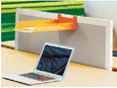
Absorbiert Schall und sorgt für Privatsphäre: das Privacy Panel