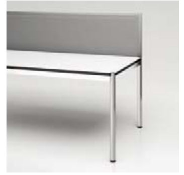
04 Privacy Panel Stoff