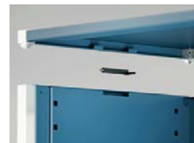
Kunststoffverbinder für die werkzeuglose und sichere Montage