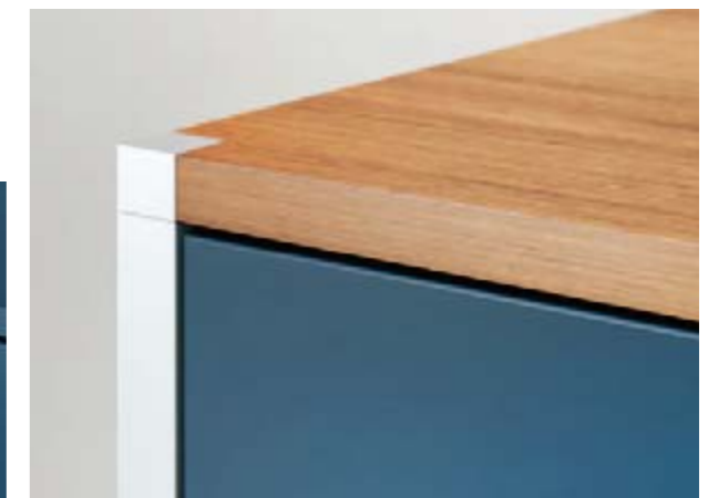
Abschlussplatte in edlem Holz furnier