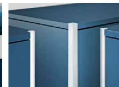
Eckprofile: Rondo mattverchromt, Quadro Aluminium eloxiert natur, Rondo glanzverchromt