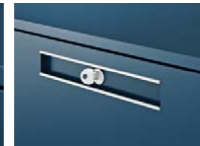
FIRST-Wechselzylinder für den einfachen Umbau