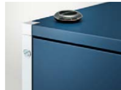
Elektronischer Verschluss auf Funkbasis

Unterlagen und persönliche Objekte können Sie mit dem praktischen Zentralverschluss schützen: Eine Umdrehung genügt und alle Klappen und Schubladen sind zu – das gibt es übrigens auch mit einer elektronischen Steuerung.