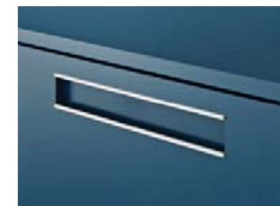
Formschöner Griff aus Aluminium / Stahl

An vorderster Front im Verkauf oder auf der Chefetage: step'modul bietet funktionale und formschöne Lösungen für alle Ansprüche. Abschlussplatten mit Echtholz furnier streichen die Hochwertigkeit der Möbel noch hervor. Verleihen Sie repräsentativen Räumen eine besondere Note, spielen Sie mit Farben oder Materialien.