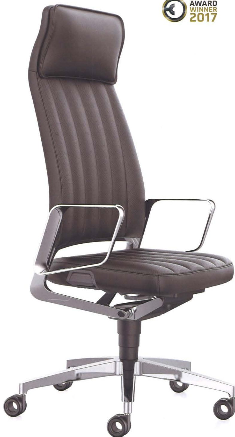
PRODUKTDESIGN: VOLKER EYSING