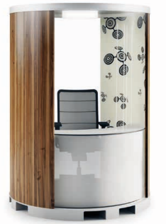
Edle Materialien: Holzfurnier und Tapete bringen Wohnlichkeit ins Büro.