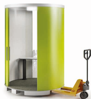
Mit einem Handstapler lässt sich die drum'box an jeden beliebigen Ort verschieben.