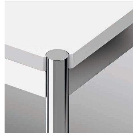
10 Fussform Rondo glanzverchromt