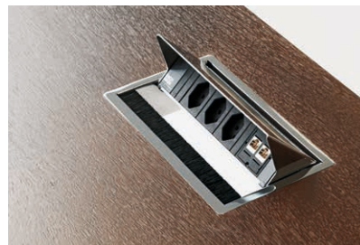
Praktisch für den schnellen Zugriff: die Mediabox