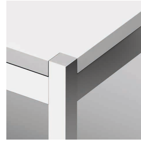
11 Fussform Quadro Aluminium eloxiert natur