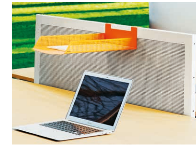
Absorbiert Schall und sorgt für Privatsphäre: das Privacy Panel