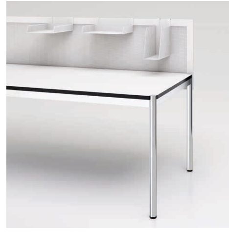
03 Privacy Panel Stahl