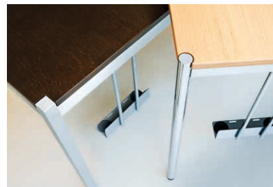
CPU-Halter: damit der PC nicht auf dem Boden steht