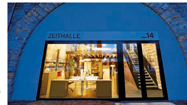
Fotografiert in den Viaduktbögen in Zürich

multi'desk mit dem Rundprofil Rondo (Edelstahl in Glanzchrom) bekommen Sie in verschiedenen fixen Höhen und mit Rasterhöhenverstellung. So bringen Sie die Arbeitsplatte spielend leicht auf Ihr ergonomisch optimales Niveau. Die kantige Version Quadro (Aluminium eloxiert natur) gibt es in einer fixen Höhe. Unabhängig von der Optik: multi'desk kann durch Zubehör jeder Art ergänzt werden, um Ihnen das Arbeiten so angenehm wie möglich zu gestalten.