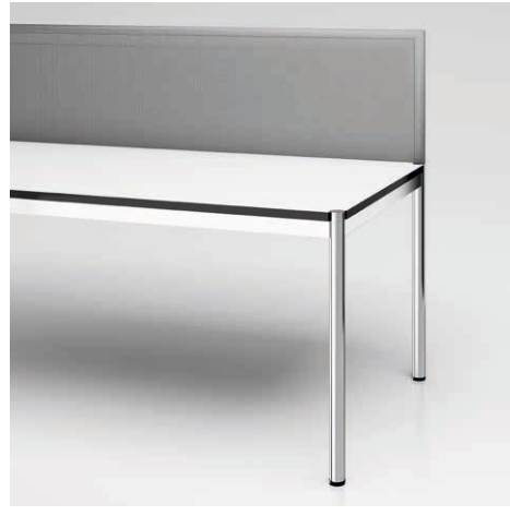
04 Privacy Panel Formfac 4