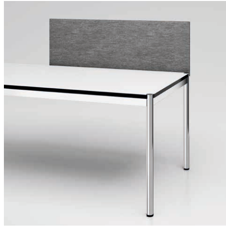
05 Privacy Panel BuzziDesk