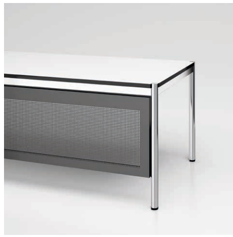
08 Tischrückwand Formlochblech