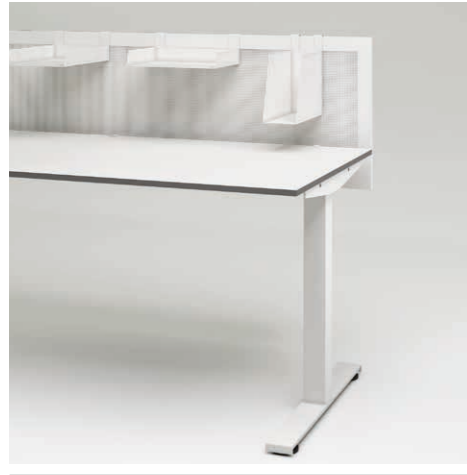
04 Privacy Panel Stahl