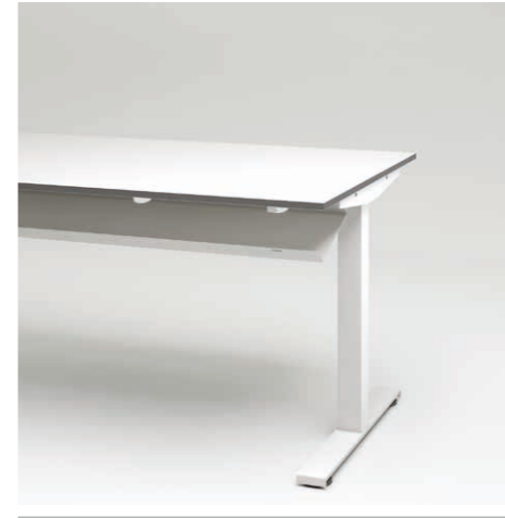
10 Kabelkanal beidseitig klappbar