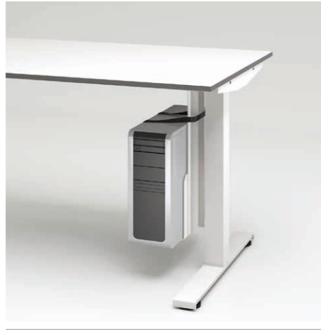
02 CPU-Halter innen montiert