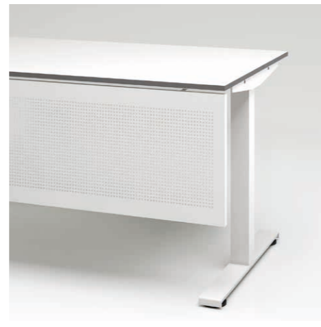
09 Tischrückwand Formlochblech