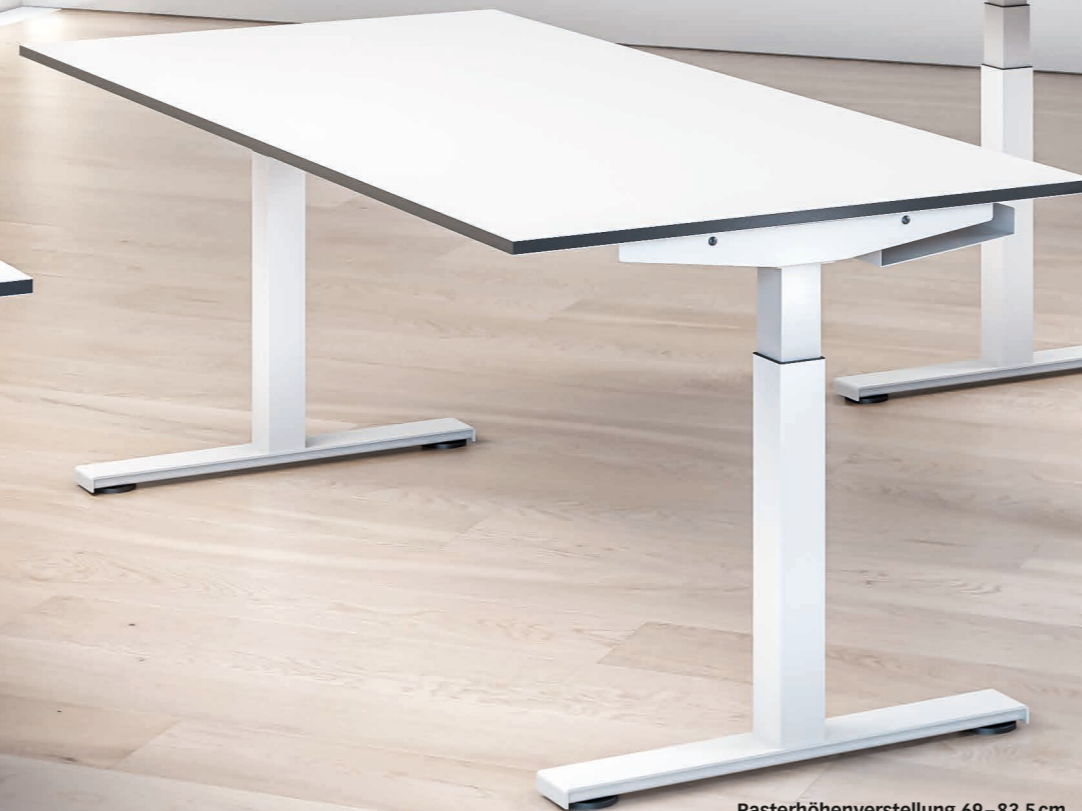
Rasterhöhenverstellung 69–83.5 cm