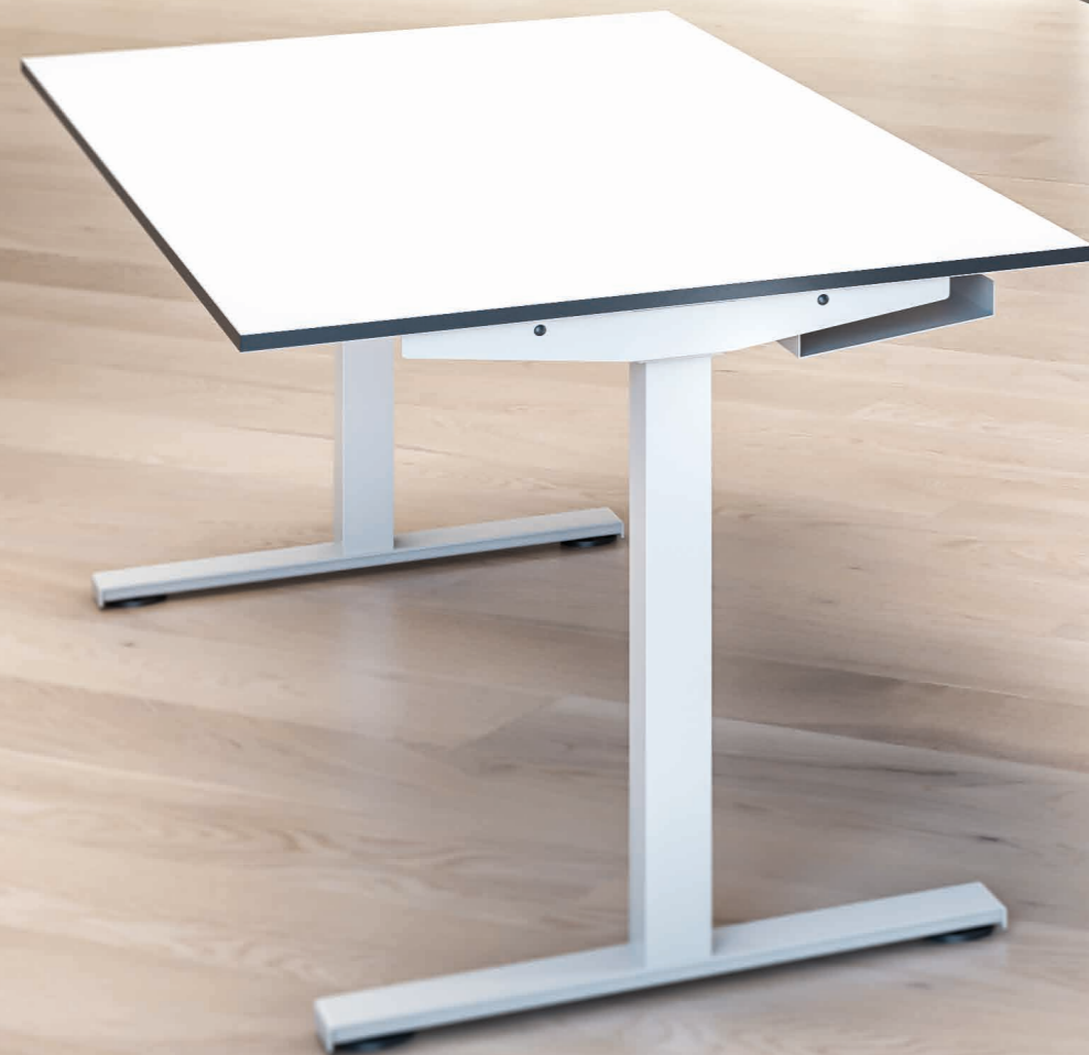
fixe Höhe 75 cm

Eine Tischfamilie für Puristen: Wer eine funktionelle Arbeitsatmosphäre bevorzugt, liegt mit plain'desk richtig. Mit seiner ehrlichen, schnörkellosen Optik passt er sich jedem Umfeld und Stil an. Zur Wahl stehen Konferenztisch, Tisch mit Rasterhöhenverstellung und elektrisch verstellbarer Sitz-/Stehtisch. Der T-Fuss sorgt für genügend Beinfreiheit. Praktisch: plain'desk lässt sich individuell mit vielseitigem Zubehör ergänzen und jederzeit umrüsten. Noch dazu ist der plain'desk preislich attraktiv – bei gewohnt hoher Qualität: Ergodata setzt auf Schweizer Design und nachhaltige Produktion.