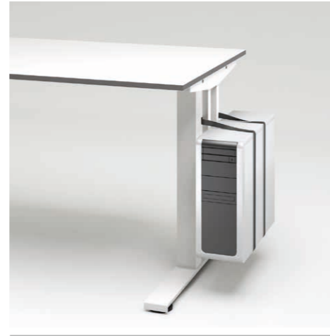
03 CPU-Halter aussen montiert