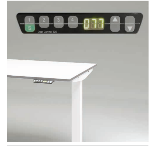
12 Memory-Display mit 4 Speicherplätzen