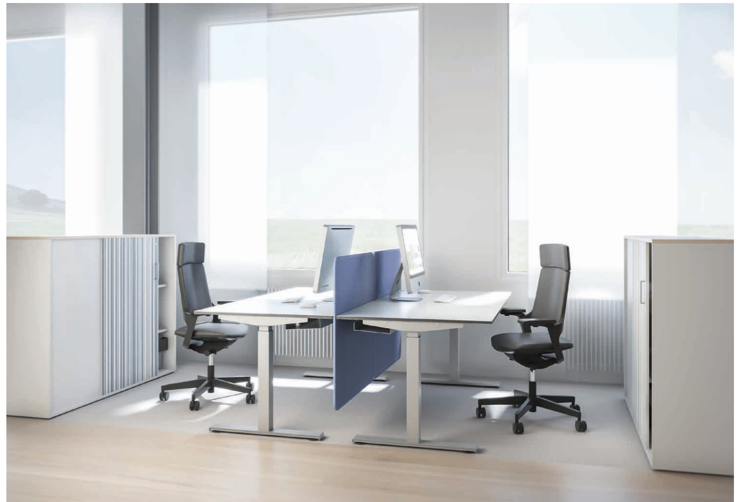
Typisch plain'desk: schlicht und unkompliziert