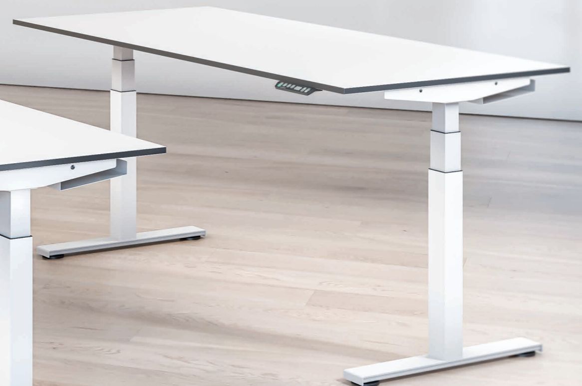
Elektrisch verstellbarer Sitz-/Stehtisch 70–125 cm