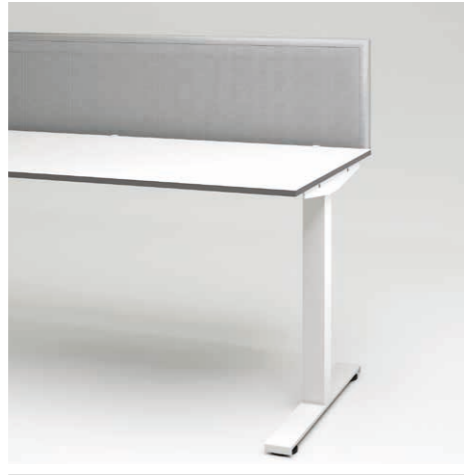
05 Privacy Panel Formfac 4