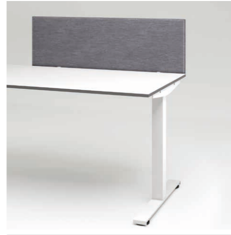
06 Privacy Panel BuzziDesk