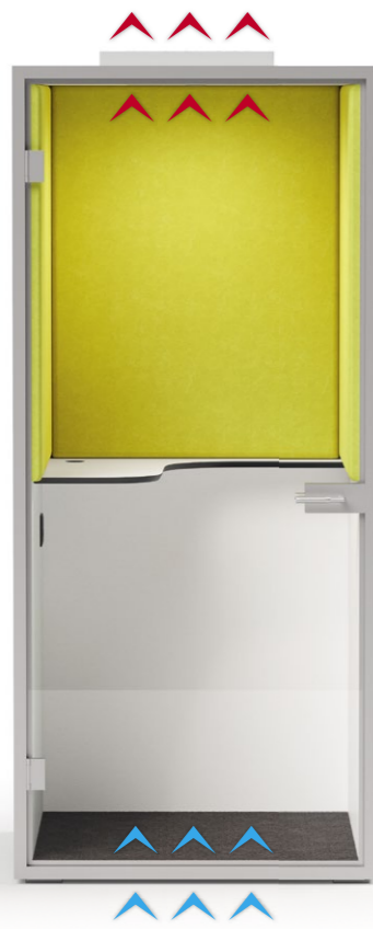
Rückwand aus Vollwand, mit Akustikissen seitlich und rückseitig oberhalb Tischablage. Frischluftzufuhr über den Boden, Abluft über die Decke, Luftumwälzung ca. 50m 3 /Std.. Breite 100 cm, Tiefe 100 cm, Höhe 225 cm.