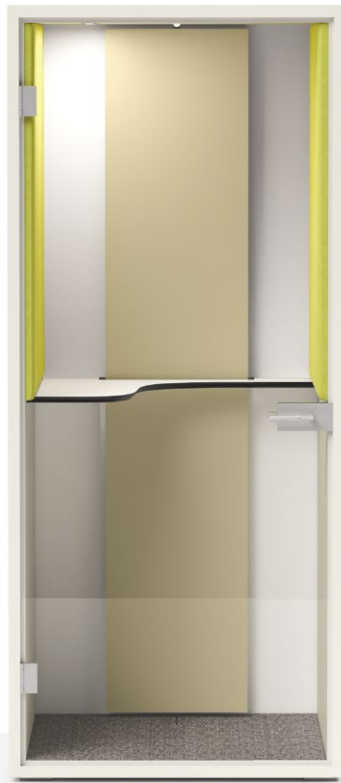
Rückwand aus Vollwand mit vertikaler Lüftungseinheit, Akustikissen seitlich oberhalb Tischablage. Frischluftzufuhr und Abluft seitlich über die Lüftungseinheit aussen, Luftumwälzung ca. 150m 3 /Std.. Breite 100 cm, Tiefe 100 cm, Höhe 225 cm.