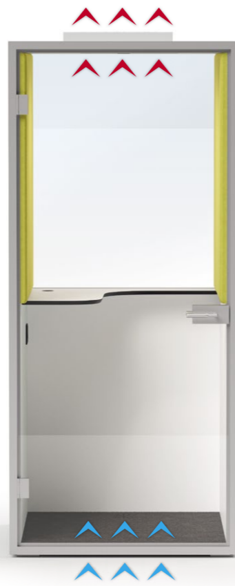
Rückwand aus Glas oberhalb der Tischablage, mit Akustikissen seitlich oberhalb Tischablage. Frischluftzufuhr über den Boden, Abluft über die Decke, Luftumwälzung ca. 50m 3 /Std.. Breite 100 cm, Tiefe 100 cm, Höhe 225 cm.