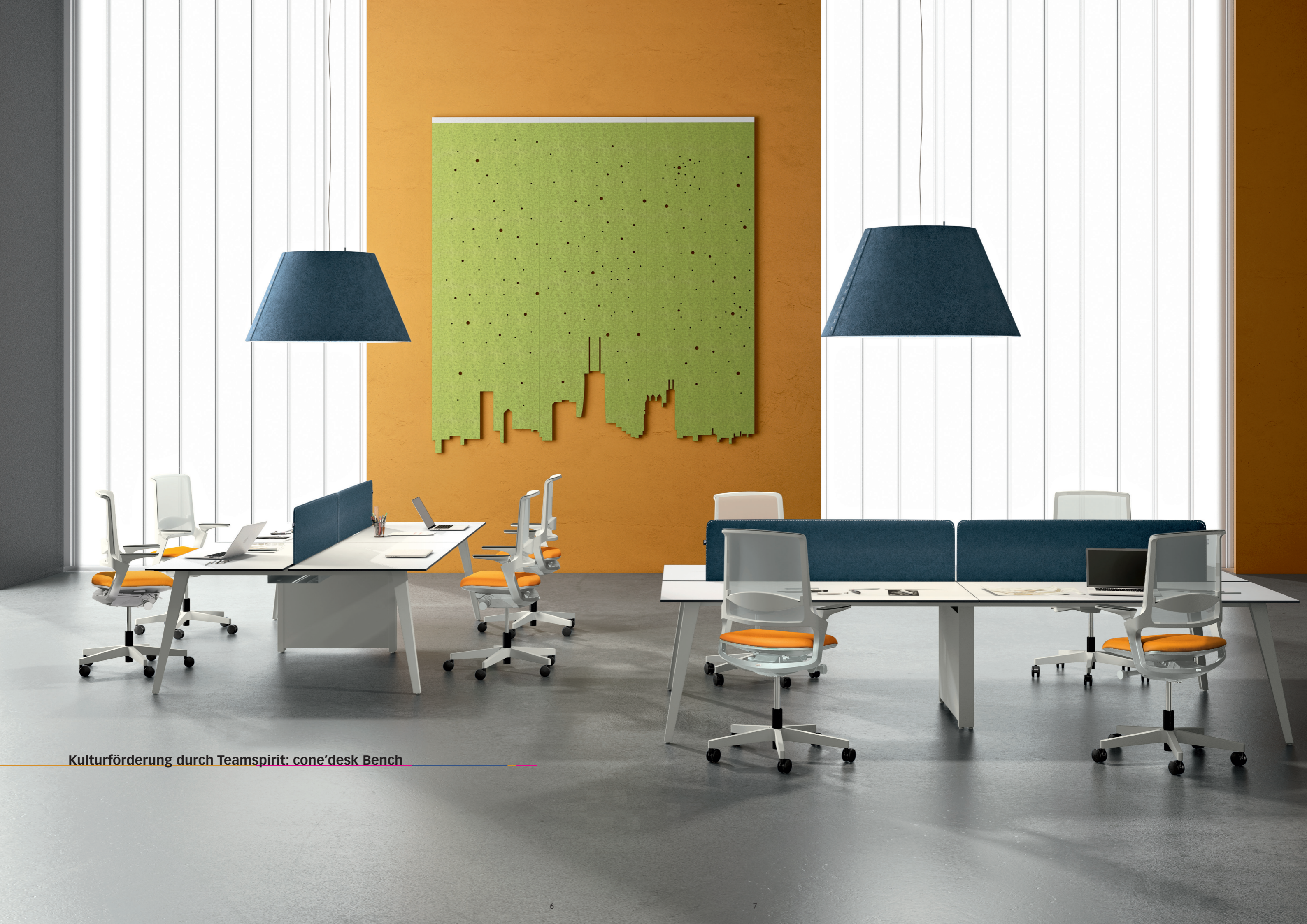
Kulturförderung durch Teamspirit: cone'desk Bench